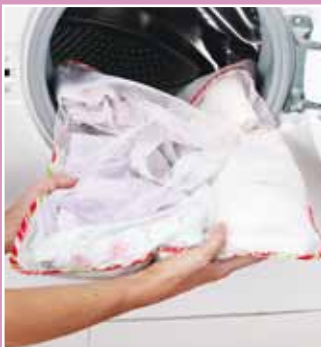
WOREK DO PRANIA Kod 39503