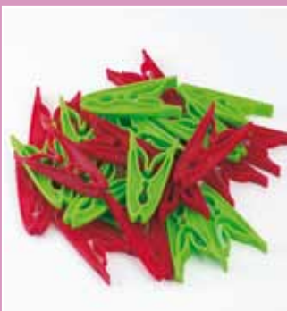
NIERDZEWNE SPINACZE DO PRANIA Kod 39995