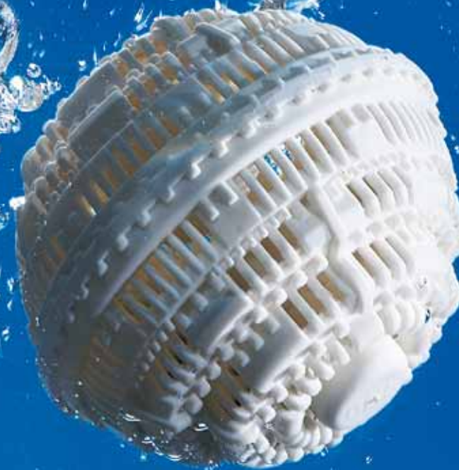
EKOLOGICZNA KULA DO PRANIA Kod 56506