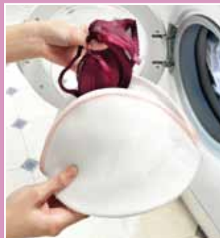
WORECZEK DO PRANIA BIUSTONOSZY Kod 38461