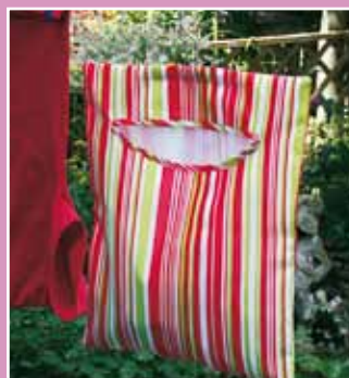
TOREBKA NA SPINACZE Kod 39112

WSZYSTKIE PRODUKTY Z OFERTY BETTERWARE OBJĘTE SĄ 100% GWARANCJĄ JAKOŚCI.